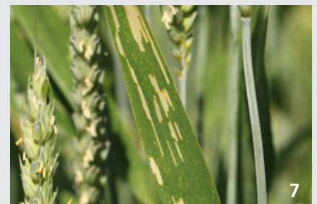
Des essais dans des champs de blé et de pommes de terre ont montré que les dégâts dus aux criocères (6) ou aux pucerons pouvaient être réduits jusqu'à 60% grâce aux bandes fleuries.